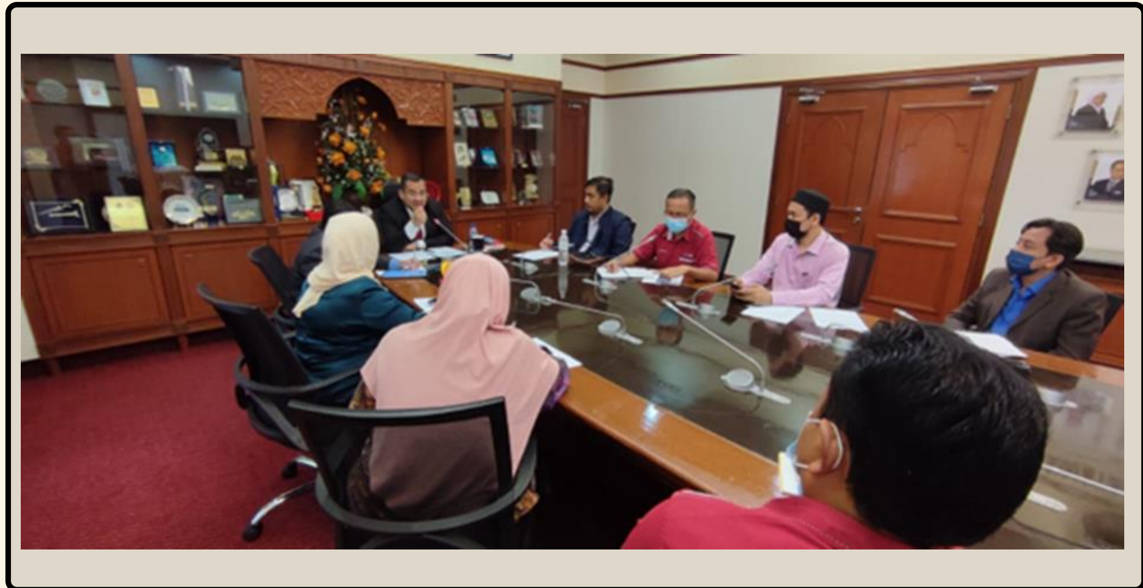
PERTEMUAN NAIB CANSELOR USIM BERSAMA EXCO PKAUSIM

Bilik Mesyuarat Naib Canselor, USIM – Pada 25 Julai 2022, telah diadakan Mesyuarat Jawatankuasa PKAUSIM bagi tahun 2022, bertempat di Bilik Mesyuarat Naib Canselor, USIM. Mesyuarat itu telah dipengerusikan oleh Naib Canselor USIM. Antara usul yang dibawa oleh PKAUSIM adalah pembinaan pejabat PKAUSIM, penawaran geran RM2000 bagi pensyarah baharu yang tidak mempunyai sebarang geran penyelidikan bagi pembudayaan penyelidikan, mewujudkan polisi bagi menjaga kebajikan staf akademik yang mempunyai anak kurang upaya (OKU), memperkasakan jurnal di bawah myCite. Wujudkan indeks Malaysia yang setara dengan Scopus dan Tiada sebarang aktiviti atau mesyuarat dalam tempoh marking crucial 10 hari.