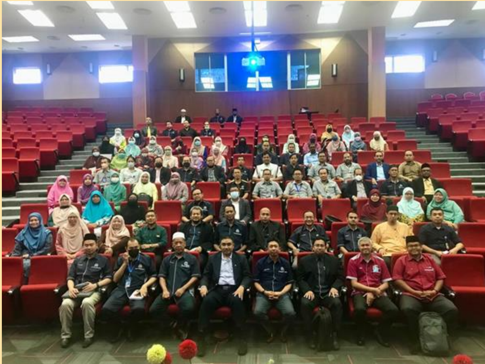
Antara peserta yang hadir